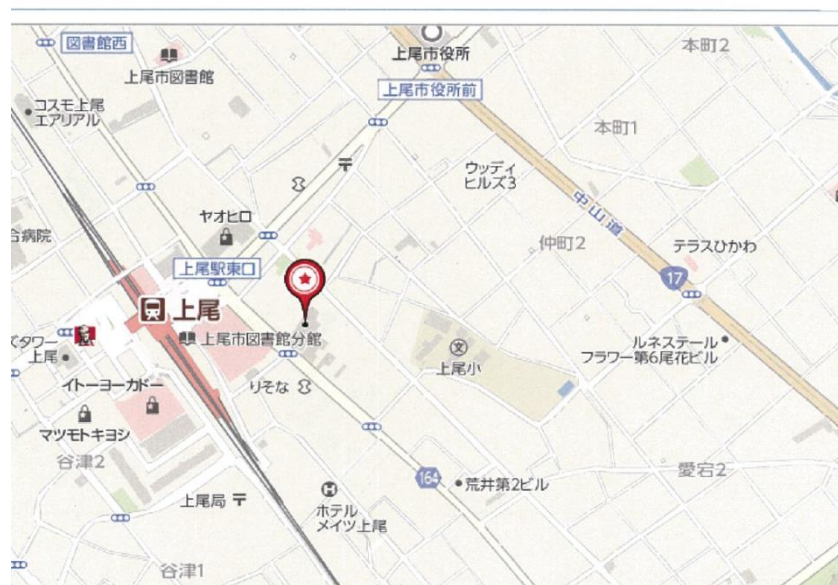
埼玉県上尾市仲町1丁目7-23周辺の地図