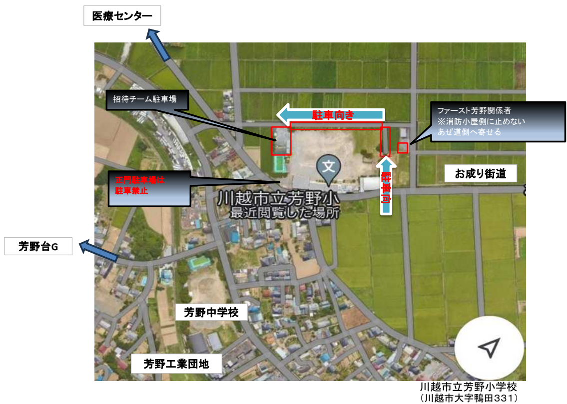
川越市立芳野小学校 (川越市大字鴨田331)